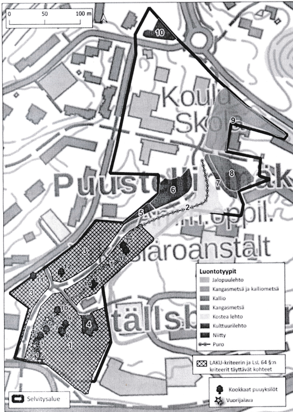
Kuva 6. Selvitysalueen luontotyypikuvioit (ks. taulukko 1). Rakennettuja alueita ei kuvioitu. Kuvassa lisäksi kookkaat puuyksilöt (ks. taulukko 2) ja vuorijalavaesiintymät.

Liite 1: Ote Luontoselvitysraportista (sivu 17): Manninen, E., Pippingsköld, E., Vasko, V., Leinikki, J. & Nieminen, M. 2023: Luontoselvitykset Postipuun koulun ja päiväkodin asemakaavam muutoksen alueella sekä Puustellinpuistossa vuonna 2023. – Faunatican raportteja 66/2023